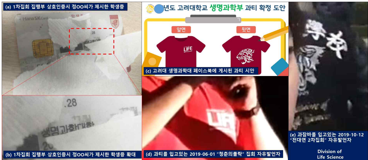
[그림 8] 생명과학대 소속 정OO씨(=ws961028)로 추정되는 인물이 고려대 1차집회 집행부원을 인증할 때 사용한 학생증과, 자유로정렬 주관 “청춘의몰락” 집회의 생명대소속 참가자, 그리고 전대연 2차집회의 생명대소속 참가자

어제 대학로에서 열린 전대연 2차집회(10/12)에서 마스크를 쓴 채 고려대학교 생명과학대 과잠바를 입으며 발언을 한 사람이 있었습니다. 그리고 이 사람은 2019년 6월 1일 자유로정렬이 주관한 “청춘의 몰락” 집회에서 생명과학대 과티를 입고 자유발언을 했습니다.