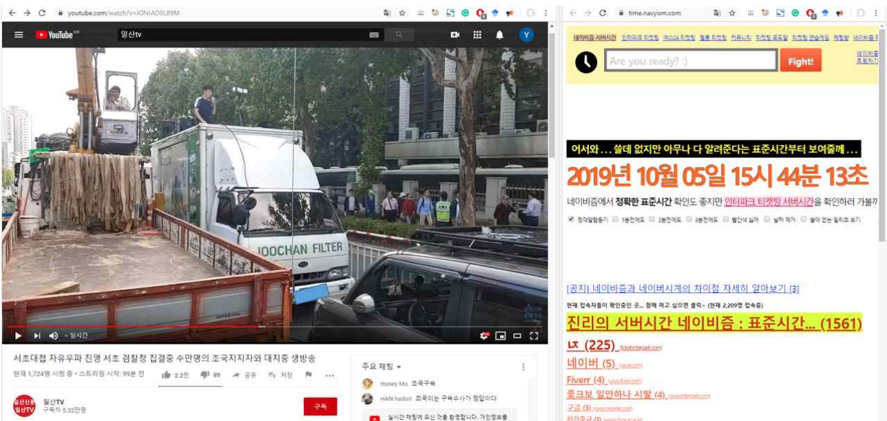
[그림 6] 보수집회 활동가 OO택씨가 10/5일 서초동 집회에 차량과 함께 참석한 모습