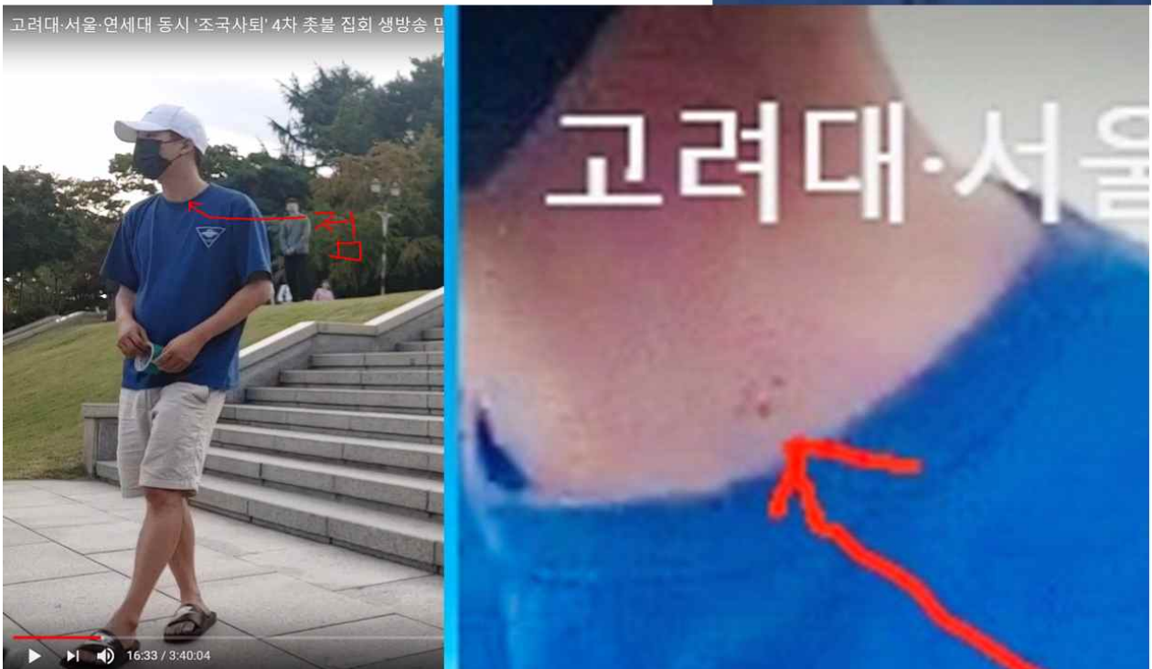
[그림 2] 자유로정렬 대표의 고려대학교 9/19일 집회 참석 증빙