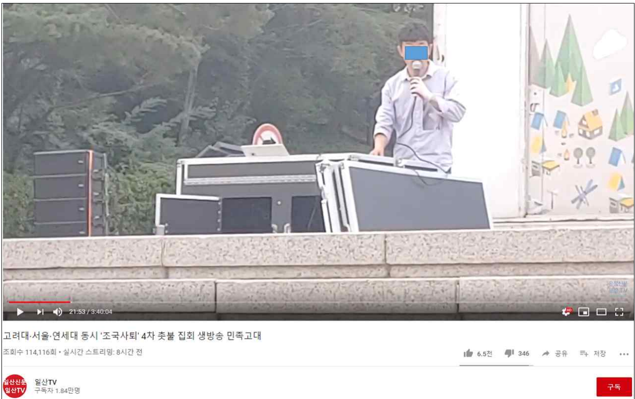
[그림 4] 보수집회 활동가 OO택씨가 9/19일 집회 당시 고려대 중앙광장에서 음향장비를 조작중인 모습

그리고 현장에서 음향 믹서를 설치하고 총괄한 사람은 보수집회 활동가 OO택 씨였습니다. 그는 지난 2017년부터 박근혜 전 대통령의 석방을 요구하고 있으며, 최근 시국에도 광화문, 서초동, 여의도 등 각지를 돌며 2) 보수집회 인사들과 함께 집회를 이끄는 사람입니다. 또한, 자유로정렬이 주관한 광화문 토요일 집회 “청춘의 몰락”에 음향장비 및 무대장비를 지속적으로 제공했던 인물입니다.