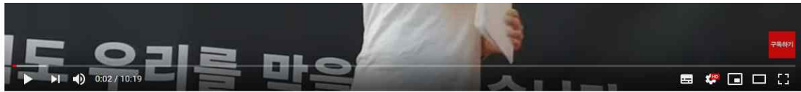
#개미애국방송 "잘못된 것은 당연히 바로 잡아야" | 이 고려대 졸업생 | 조.국 임명반대 청년들 모임.19.08.24 조회수 8,222회 · 2019. 8. 24.

그리고 이 글에서 해당 시간에 열리는 집회는 다름 아닌 자유로정렬의 집회였습니다.