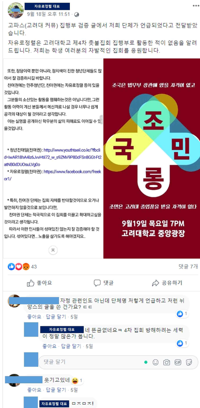
[그림 3] 자유로정렬 대표가 밝힌 고대집회 미참석 입장

자유로정렬 대표 오OO씨께서는 지난 9/18일 23시 51분에 본인 페이스북에 공개 글로서 올린 다음의 자유로정렬 단체 입장문에서 “자유로정렬은 고려대학교 제4차 촛불집회 집행부로 활동한 적이 없음을 알려드립니다.”라고 언급하시고 왜 고려대학교 9/19 집회에 참석하신 것인지 해명 바랍니다.