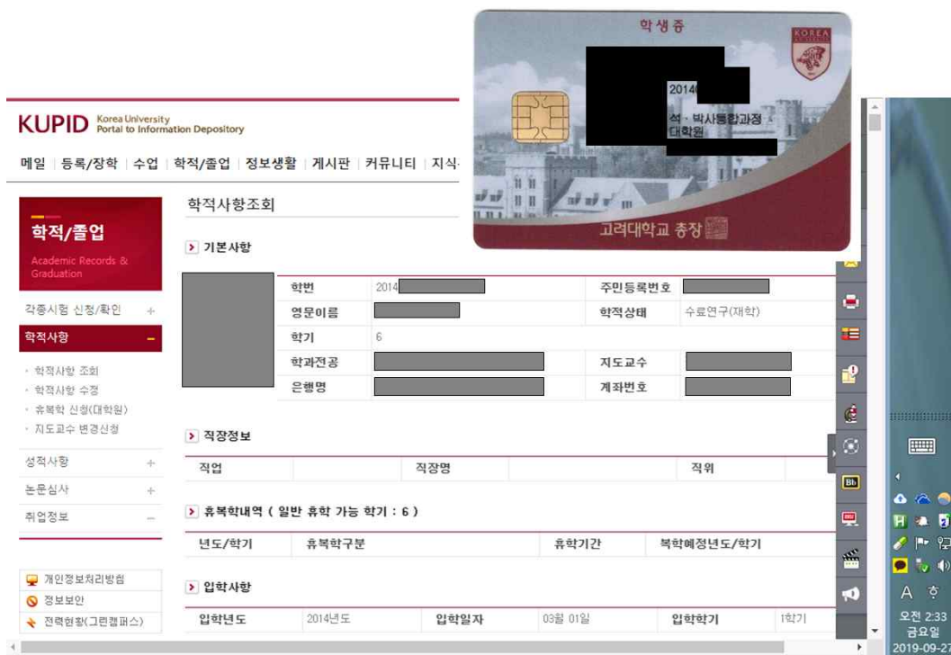
[그림 1] KUPID(포털)과 학생증 인증 자료